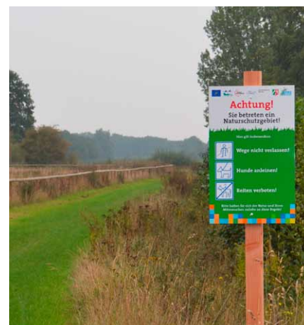
Abbildung 3: Umsetzung einiger Anregungen aus der Bürgerumfrage (Bänke, Hinweisschilder)