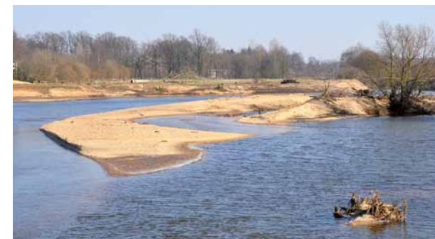
Naturnahe Gewässer- und Auenentwicklung der Ems bei Eimen – Eigendynamik und Habitatvielfalt