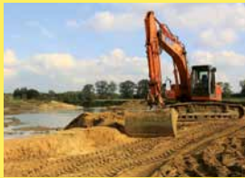
Bagger im Einsatz