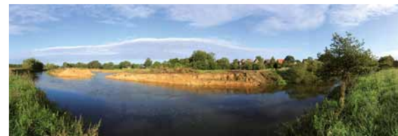
Bereich der renaturierten Ems