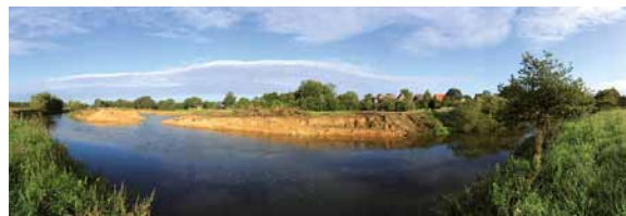
Bereich der renaturierten Ems

Das Projektziel ist es, die Ems im Raum Einen auf einer Länge von etwa vier Kilometern zu renaturieren und erheblich ökologisch zu verbessern. Das Life-Projekt stellt im Raum Einen den ersten Schritt zu einem wieder naturnahen Fließgewässer dar. Darüber hinaus ist es ein wichtiger Baustein für die Umsetzung der Europäischen Wasserrahmenrichtlinie an der Ems, auf dem Weg zu einem guten ökologischen Zustand der Gewässer.