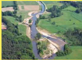
Ems mit Laufverlängerung